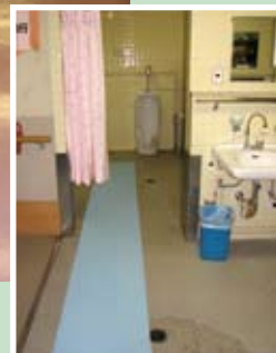
濡れやすくすべりやすい トイレ・洗面所