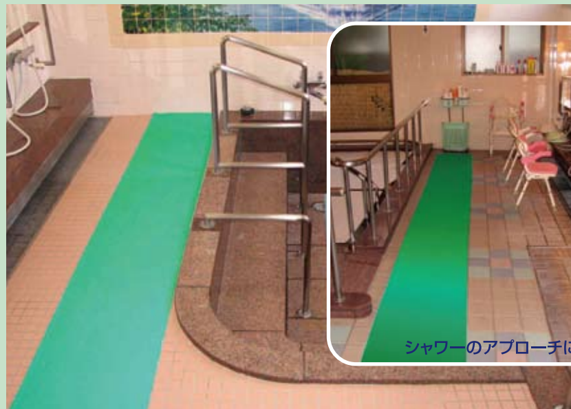
洗い場のすべり止め