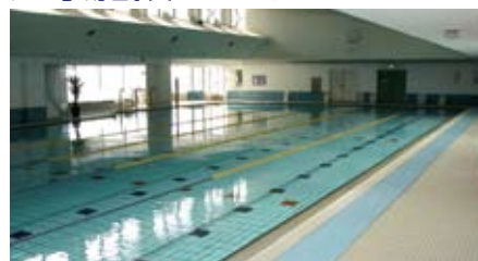
プールサイドのすべり止め