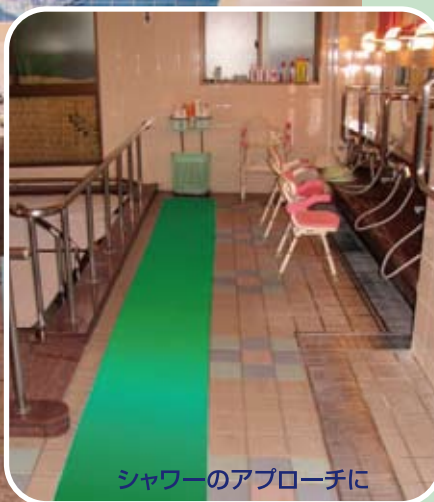
シャワーのアプローチに