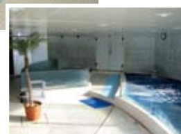
お風呂への出入口