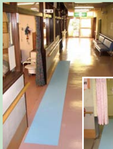
廊下のすべり止め